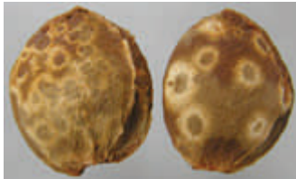
Sharka Symptome an Aprikosensteinen

Eidgenössisches Volkswirtschafts- departement EVD Forschungsanstalt Agroscope Changins-Wädenswil ACW