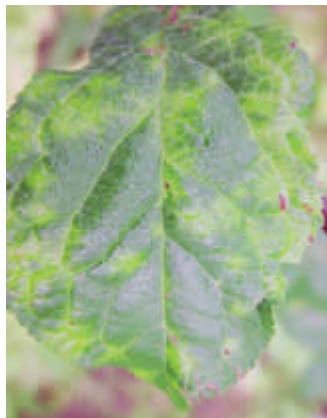
Symptome an Fellenberg Blattsymptome an Fellenberg FAW2