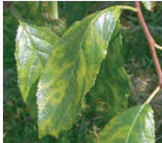
Sharka Blattsymptome an der Zwetschge Fellenberg