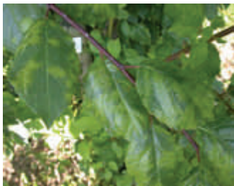
Symptome an Elena B lattsymptome an Elena