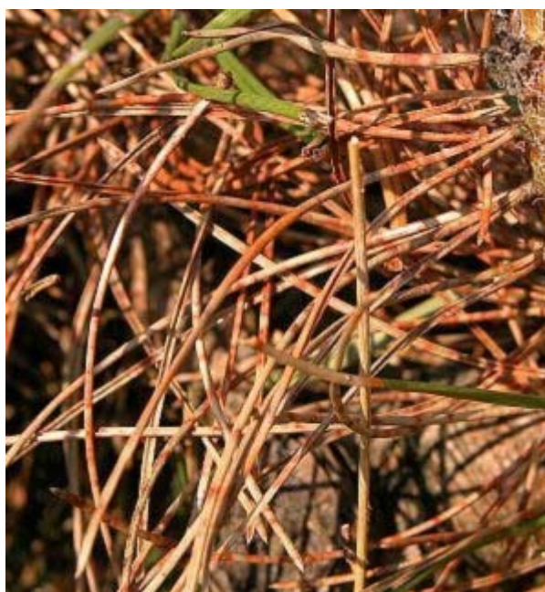
Bild 4: Auf den Nadeln der Schwarzföhre sind die orangen Farbbänder besonders ausgeprägt.