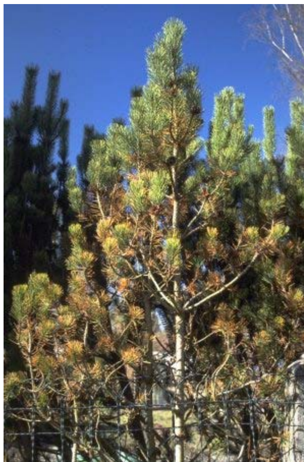
Bild 1: Bei der Dothistroma -Nadelschütte verkahlen die Bergföhren von unten her.

Auf den Nadeln können erste Infektionen mit Einstich- oder Frassstellen von Insekten verwechselt werden, wie z.B. mit dem Föhrennadelscheidenrüssler ( Brachonyx pineti ). Im Unterschied zum Pilzbefall findet man jedoch anstelle des erhabenen Pilzfruchtkörpers ein Loch, einen Einstich oder Harzaustritt. Auf Niveau