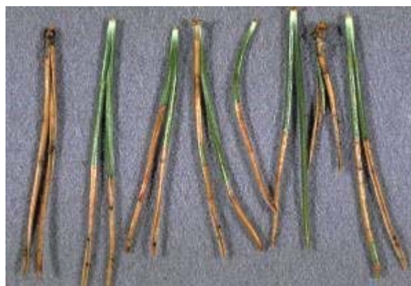
Bild 2: Nadeln von Bergföhre mit befallenen, braunen Nadelsegmenten, auf welchen die winzigen Pilzfruchtkörper von Dothistroma septosporum gebildet werden.