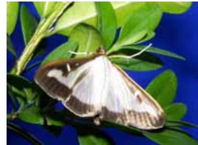
Falter des Buchsbaumzünslers