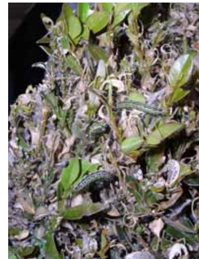
Fraßschäden und Gespinste durch Raupen des Buchsbaumzünslers

Der Buchsbaumzünsler überwintert als Raupe in einem Gespinst zwischen den Blättern und z.B. in Ritzen in der Nähe der Pflanze. Im Frühjahr (je nach Witterung ab Mitte März bis Anfang April) beginnen die Raupen mit dem Fraß. Sie werden bis zu 5 cm lang und durchlaufen 6 (bis 7) Larvenstadien. Der Entwicklungsnullpunkt liegt bei ca. 7 °C. Die Raupe lebt in China vorzugsweise an dem dort heimischen Buchsbaum Buxus sinica . In Japan frisst sie am Kleinblättrigen Buchsbaum ( B. microphylla ) und dem Gewöhnlichen Buchsbaum ( B. sempervirens ), wobei B. microphylla die bessere Nahrungsquelle für die Raupe ist. Sie nimmt dabei bei Temperaturen zwischen 18 °C und 30 °C stets die gleiche (wohl optimale) Nahrungsmenge auf. Buxus sempervirens ist in Deutschland die vorherrschende Buchsbaumart, die aber auch, wie sich in den beiden Städten gezeigt hat, stark durch den Buchsbaumzünsler gefährdet ist. In Ostasien bildet der Zünsler drei (bis vier) Generationen pro Jahr. In Deutschland ist mit mindestens 2, eventuell 3 Generationen pro Jahr zu rechnen.