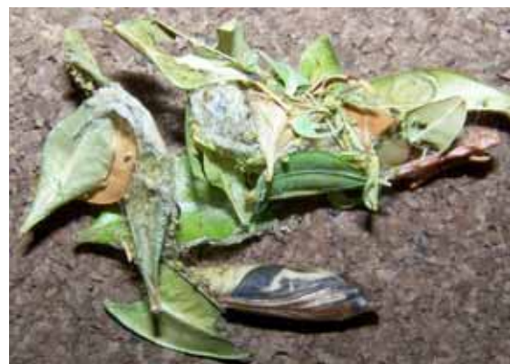
Puppenstadium des Buchsbaumzünslers