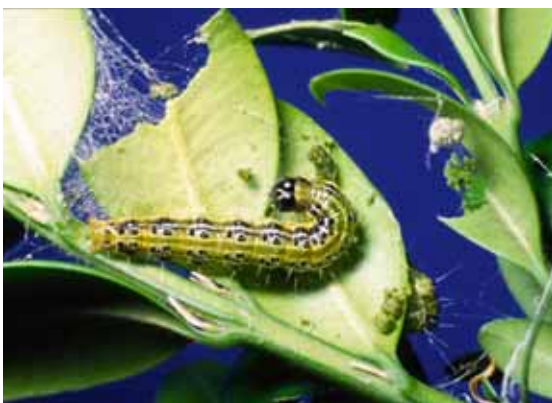
Raupe des Buchsbaumzünslers