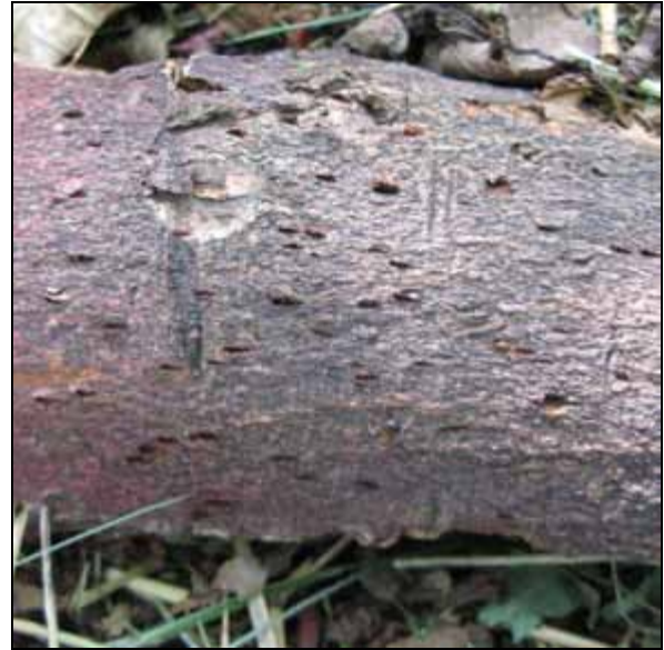
CLB: potenzielle Eiablagestellen, die vom Weibchen geprüft wurden. Kleines Bild: Ei.

Die Larven schlüpfen nach ein bis zwei Wochen und minieren zuerst zwischen Rinde und Holzkörper, um sich dann in Larvengängen abwärts im Splint- und Kernholz zu entwickeln. Über 90 % der CLB Population befindet sich unterhalb der Erdoberfläche. Bei sehr starkem Befall am Stammfuß wurden auch höher am Stamm liegende Befallsstellen beobachtet. Insbesondere bei Platanen konnten in Italien häufig auch Larvengänge und Späneauswurf sowie Ausbohrlöcher in über vier Metern Höhe festgestellt werden.