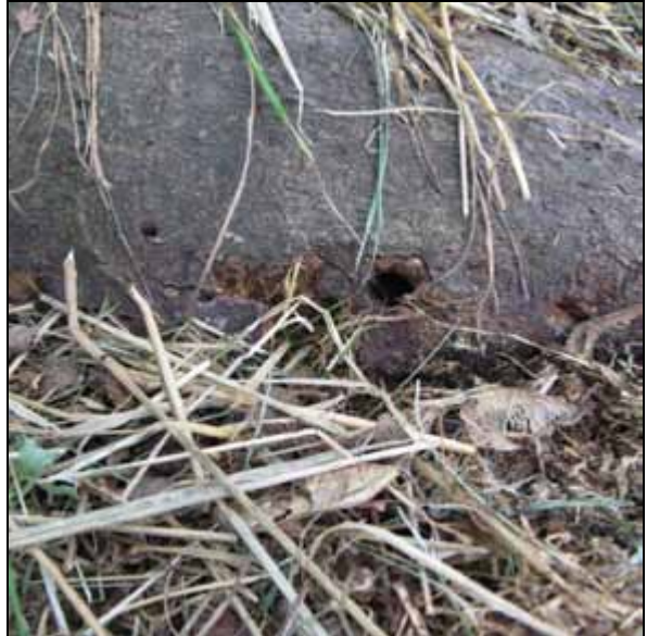
CLB: Ausbohrlöcher der erwachsenen Käfer am Stammfuß bis zu 1,5 cm im Durchmesser