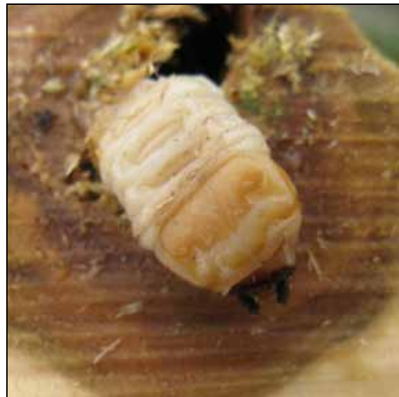
CLB: Larven, rechts: typisches Kopfschild