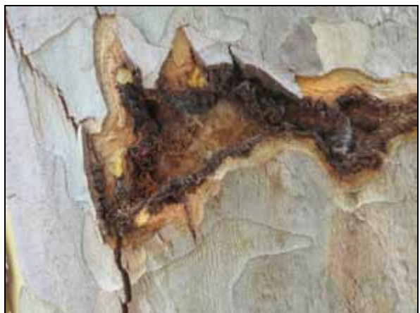
CLB: Larvengänge an Platane in mehreren Metern Höhe: rechts Ausschnittvergrößerung