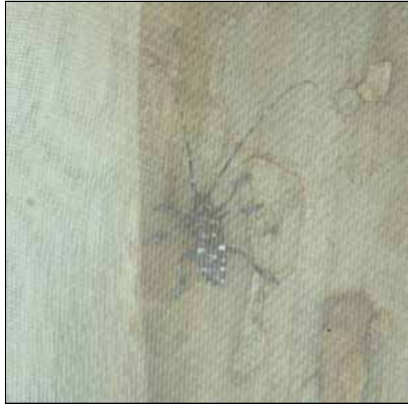
Italien: Netze um Stammanlauf zum Abfangen schlüpfender Käfer; rechts CLB unter Netz.