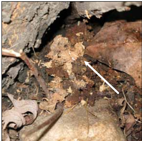
CLB: links: Ausbohrloch am Stammfuß hinter Efeu versteckt; rechts: Bohrspäne in Laubauflage